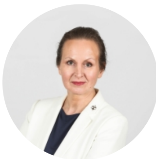
Līga Meņģelsone Veselības ministre